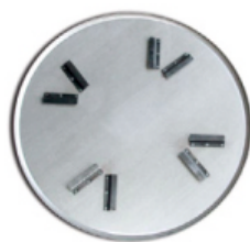
Затирочный диск с брекетовым креплением Ø 600 мм